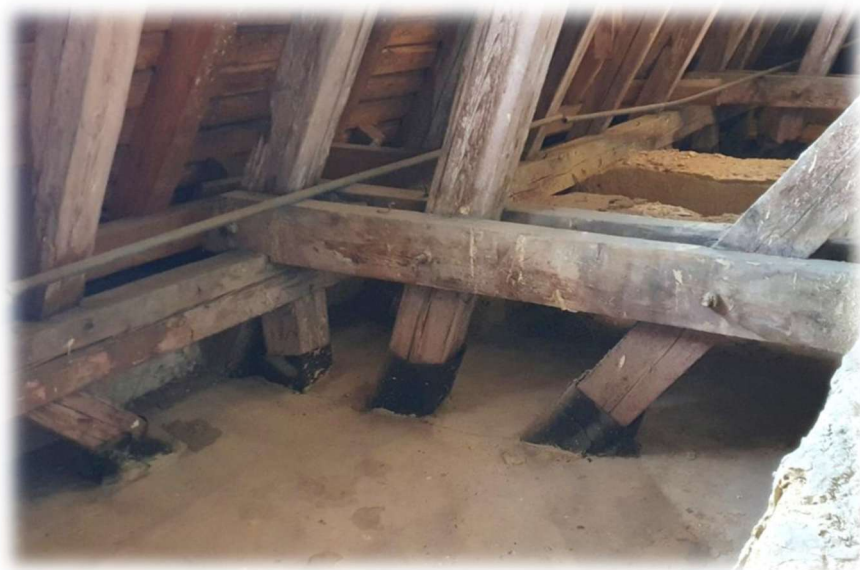
23- IZOLACE PROSTUPU KROKVÍ BET. DESKOU