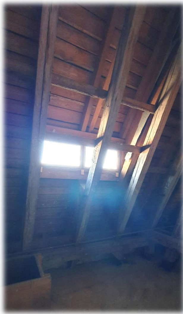
22-VIKÝŘ DO NÁDVOŘÍ