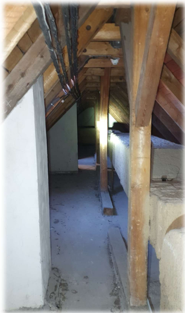
11- KROV A TĚLESA KOMÍNŮ