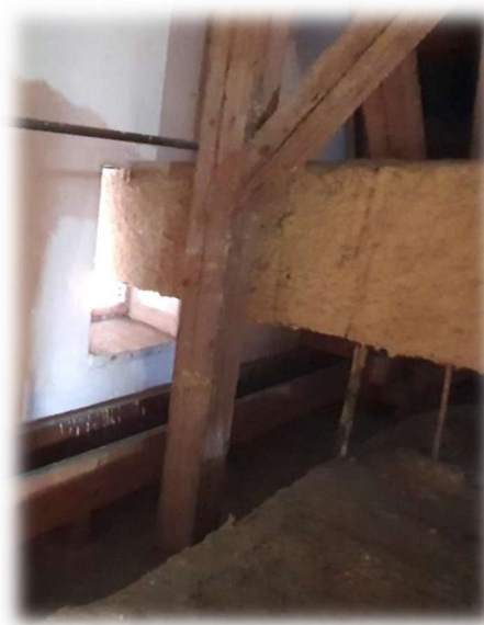
24- NASÁVÁNÍ VZT