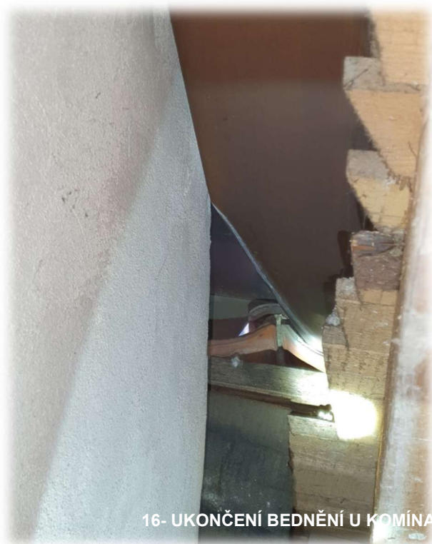
16- UKONČENÍ BEDNĚNÍ U KOMÍNA