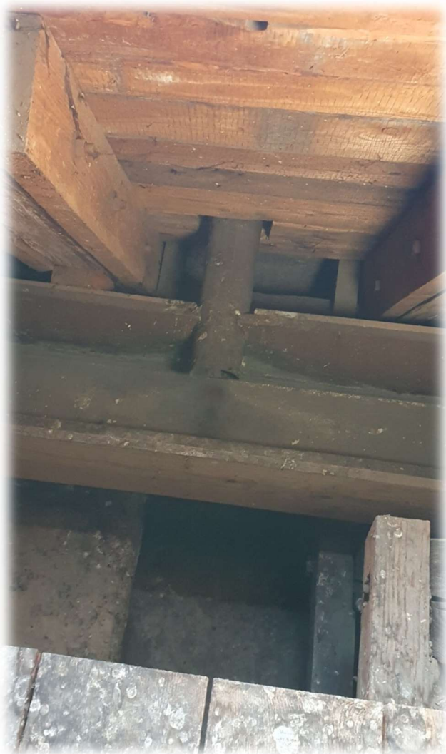
21- VNITŘNÍ DEŠŤOVÝ ŽLAB