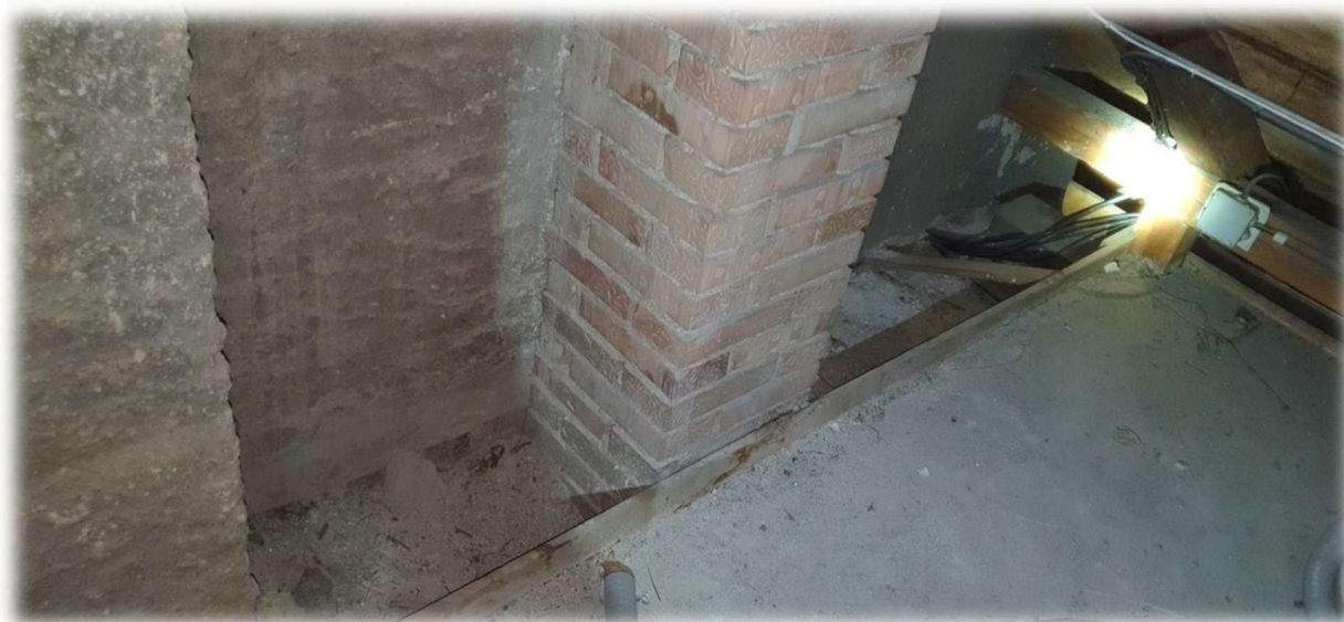
13- ŠTÍT MEZI VÝCHODNÍM KŘÍDLEM A STŘECHOU NAD SCHODIŠTĚM