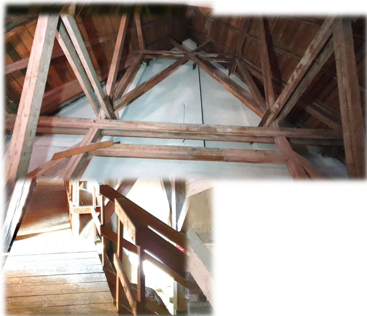
18- PŘÍSTUPOVÁ LÁVKA KE STROJOVNĚ VZT19- KONSTRUKCE KROVU