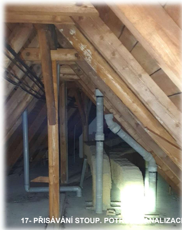
17- PŘISÁVÁNÍ STOUP. POTR. KANALIZACE